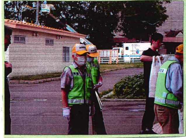
町内会の方 来てくれました。