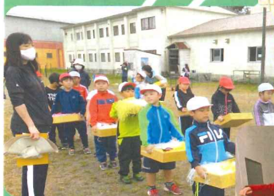
2年生 萩リンピックで