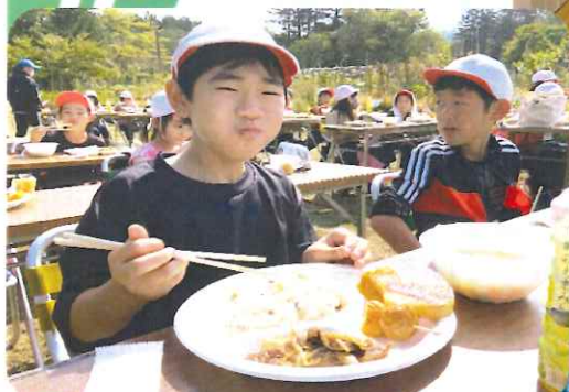
4年生 山のイオル おいしいアイヌ料理