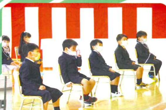
1年生 入学式の一コマ