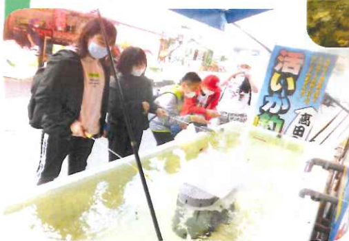
6年生 修学旅行 自主研修