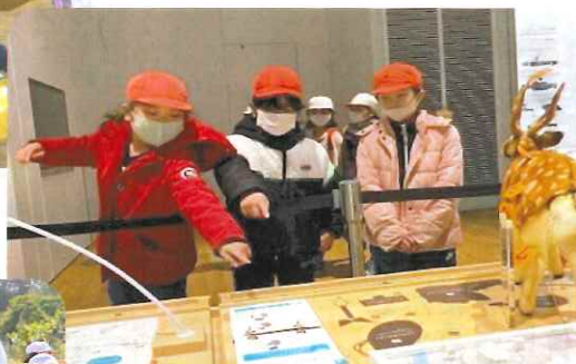
3年生 ウポポイ見学